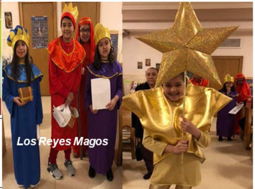
Los Reyes Magos