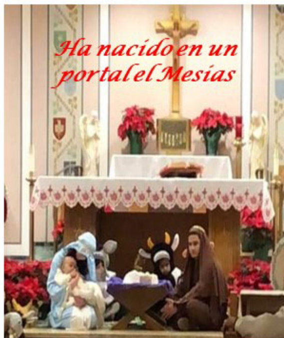
Ha nacido en un portal el Mesías