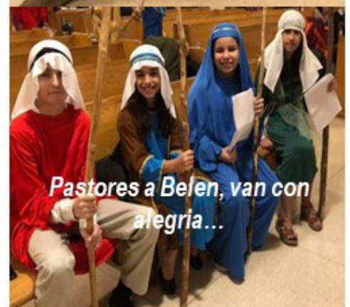
Pastores a Belén, van con alegría...